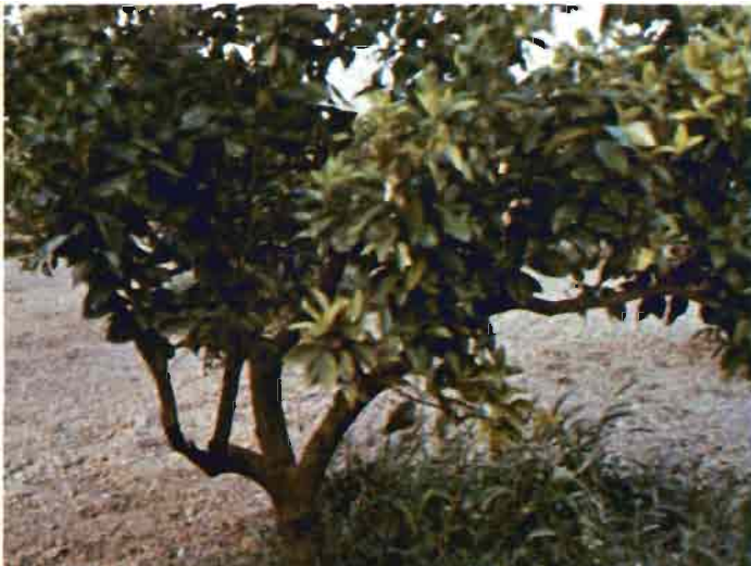
Fig. 2.—Clorosis en limonero Verna. Obsérvese el miriñaque.

El hierro puede encontrarse en estado ferroso, bien de forma temporal o, más raramente, permanente. Este hierro ferroso, relativamente soluble , sólo es estable en medios reductores y pH ácido; tales medios son poco adecuados para la vida de las raíces, por lo que hay que pensar que interviene poco en la alimentación de los cítricos. A pH neutro o básico, el hierro ferroso se oxida a estado férrico en presencia de oxígeno, originándose precipitados de hidróxidos férricos, de color amarillo o rojizo. También los minerales ferruginosos, y sobre todo los silicatos, sufren en el suelo fenómenos de degradación con producción de óxido de hierro