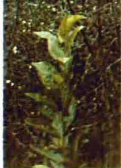
Fig. 3.—Clorosis inducida por bajas temperaturas.

El empleo de aguas de pozo en los meses de verano puede dar lugar a la aparición de síntomas cloróticos cuando estas aguas salen a una temperatura inferior al ambiente y se emplean directamente para el riego, provocando un choque fisiológico en los árboles, cuyas raíces se encuentran a una temperatura superior en varios grados a la del agua.