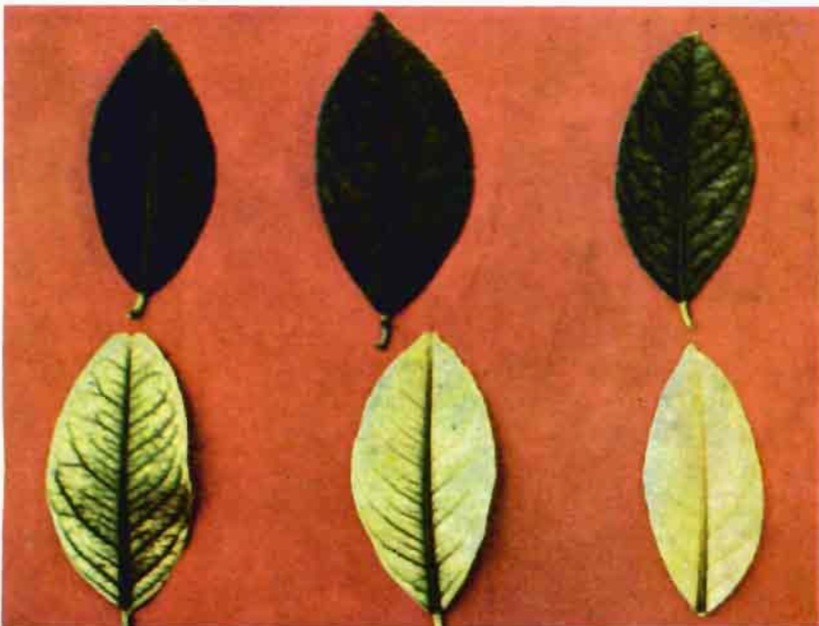
Fig. 4.—Distintos estados de la deficiencia de hierro en limonero, comparados con la hoja normal.

La materia orgánica, por su acción reductora y formadora de complejos, ejerce un efecto favorable sobre la asimilación del hierro y su movilidad en el suelo. El bajo contenido en materia orgánica en los suelos del sureste es cau-