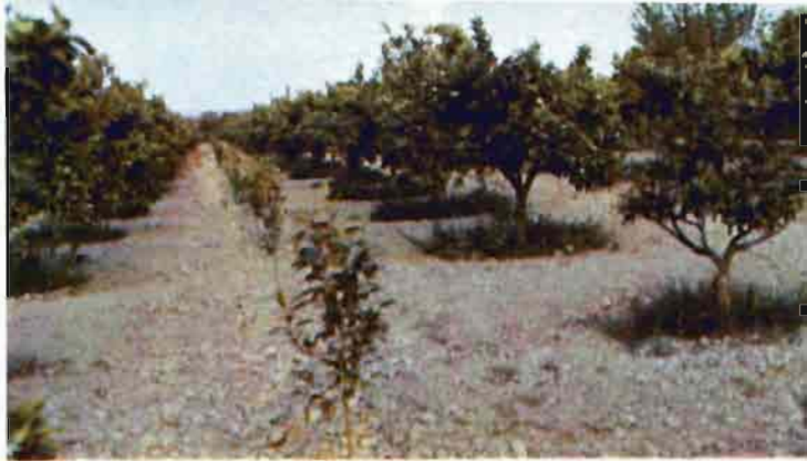
Fig. 5. — Plantación de limonero, doblada de naranjo amargo, con grado ligero de clorosis.

— La sal de Mohr (sulfato de hierro y amonio) resulta más eficaz, pudiéndose utilizar a dosis del 4 por 1.000.